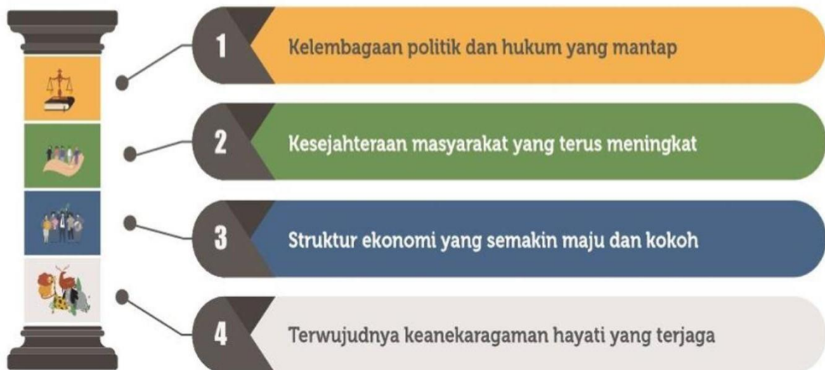
Gambar Empat Pilar RPJMN IV tahun 2020 - 2024

Rencana Pembangunan Jangka Menengah Nasional (RPJMN) 2020-2024 merupakan tahapan terakhir dari Rencana Pembangunan Jangka Panjang Nasional (RPJPN) 2005-2025. Terdapat 4 (empat) pilar dari RPJMN 2020-2024 untuk mencapai tujuan utama dari rencana pembangunan nasional periode terakhir, yaitu: